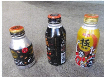
キャップのついたアルミ缶 → キャップを外す