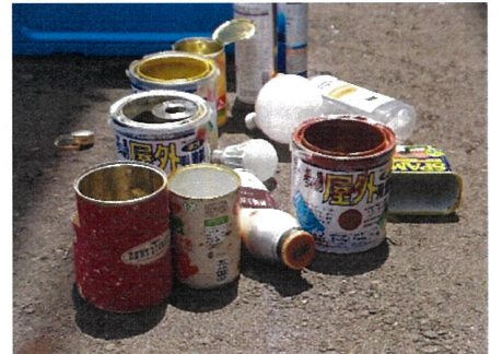
巻紙がついた缶・ペンキ缶 → ペンキ缶は燃やせないゴミへ