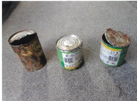
汚れた缶 → 燃やせないごみへ