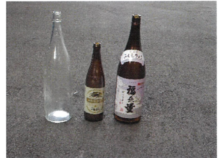
一升瓶・ビール瓶 → 販売店へ