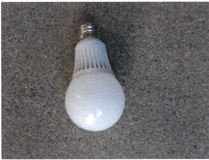
電球 → 燃やせないごみへ