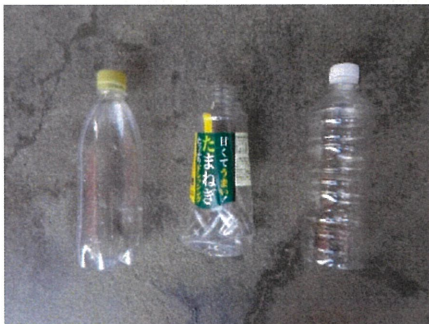
キャップ・ラベルのついた ペットボトル → キャップを外す