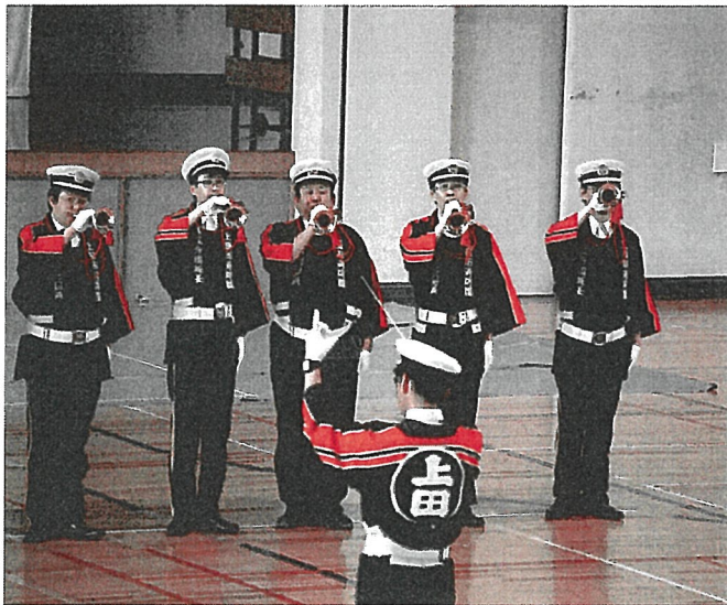
昨年の大会の様子(ラッパ吹奏)

私は昨年初めてポンプ操法を経験した以外は入団以来ラッパ吹奏に携わってきました。昨年同様上田大会や上小大会は旧上田市の右岸地域である第一・二方面隊チームでの出場となる予定ですが、全体練習が始まる五月下旬までは従来通り北小学校での練習を行う予定です。訓練を行ない、音楽としてや本来の目的である信号ラッパとしての技術向上を目指すことはもちろんのこと、ポンプ操法と同じ場所で練習することによる第三分団の一体感をより高めるきっかけにもなると思っております。また、全体練習では他地域の分団と練習を重ねることにより外とのつながりをもつこともできます。このラッパ吹奏訓練期間が今後のよりよい消防団活動の一助になると信じてメンバー全員で励んでまいります。