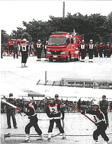
昨年の大会の様子(ポンプ操法)

消防技術の基本は操法にあり。最高の分団と最高の選手たち、自治会の皆様にもご協力いただき、結果も過程もどうなるのか楽しみます！