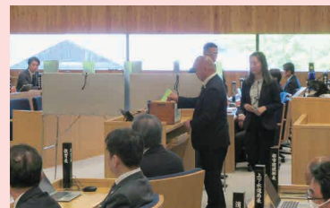
正副議長選挙の投票の様子