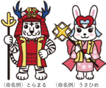
(命名例) とらまる (命名例) うさひめ

当地ゆかりの武将・真田幸村とホワイトタイガーをモチーフとした男子(左)と、 真田幸村の兄嫁にあたる小松姫とウサギをモチーフとした女子(右)です。